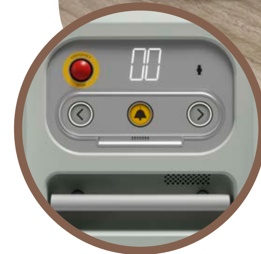
POKŁADOWY PANEL STEROWANIA